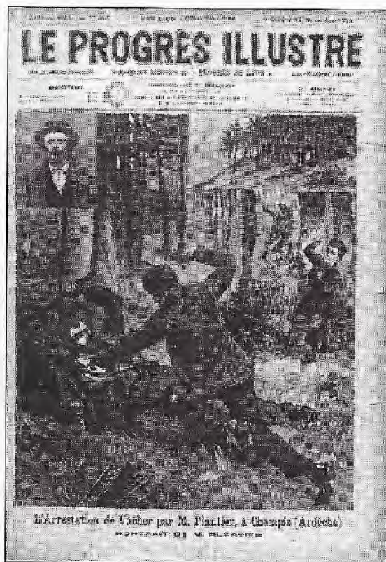
L'arrestation de vacher en Ardèche